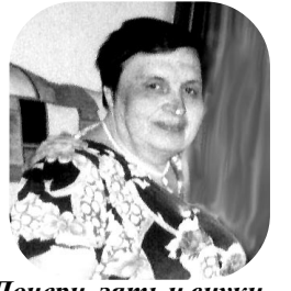
Дочери, зять и внуки.